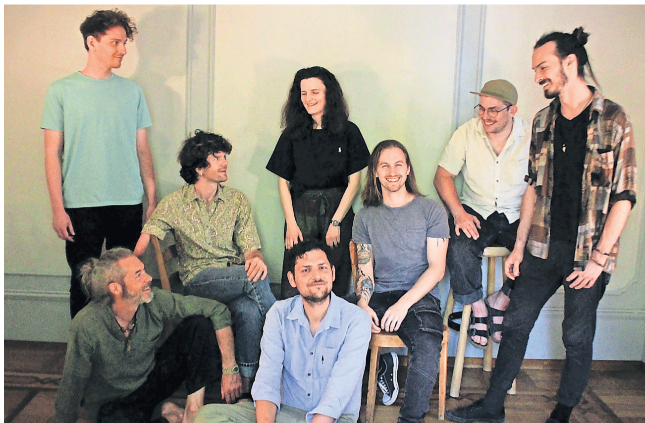
Die Band «Tan Pickney» beweist mit ihrer neuen Single eindrücklich ihre Vielseitigkeit.